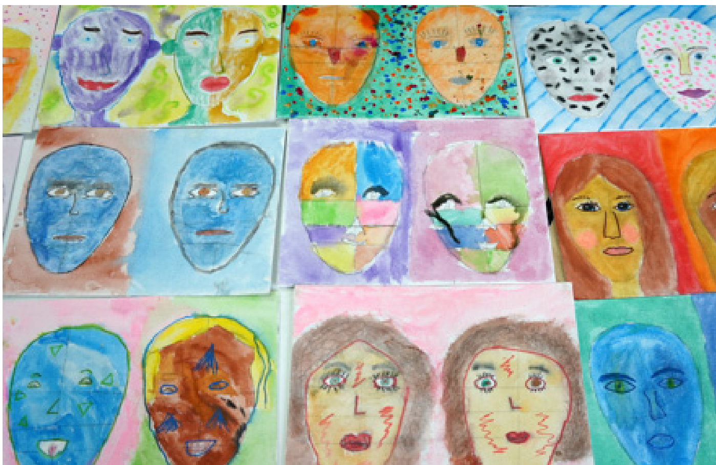
Artworkshop voor (klein)kinderen van Vrienden